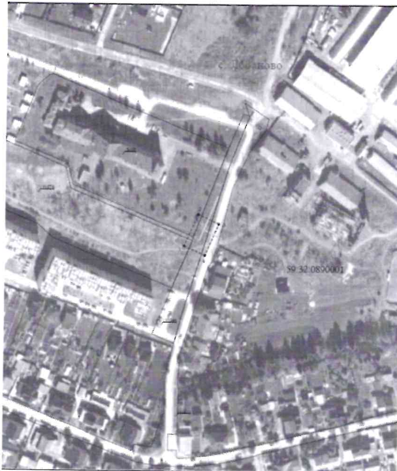
Условные обозначения приведены на листе 1